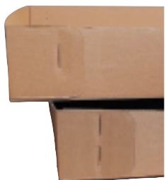
Agrafage simple et double

Alimentation automatique à partir de la palette.